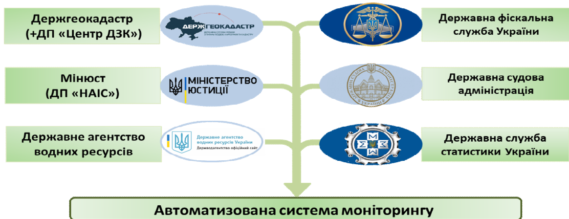
Рис. 2. Постачальники даних для Моніторингу земельних відносин в Україні

Структура Щорічника. Щорічник складається з двох частин. Частина I – “Результати моніторингу” – є довідковим матеріалом щодо стану основних характеристик земельних ресурсів та земельних відносин. Частина II – є електронною базою даних із відповідними значеннями показників моніторингу на рівні районів та міст. Усі дані перебувають у відкритому доступі та у форматі, придатному для подальшого аналізу, і будуть регулярно оновлюватися.