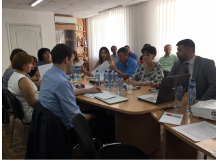
6 серпня. Миколаївська область