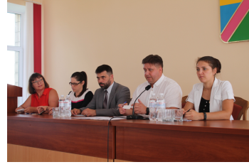
7 серпня. Київська область