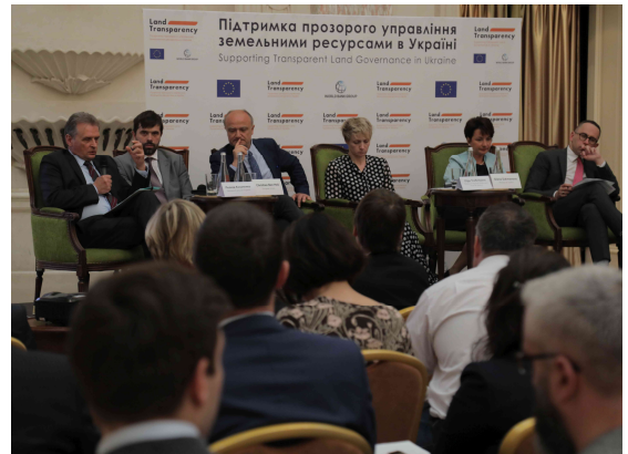
Презентація Програми. 16 травня 2018

Програму розпочато у грудні 2017. На 2018 рік заплановані заходи національного рівня та пілоти у 3 сільрадах та 2 ОТГ. Розгортання Програми на більшу кількість адміністративно-територіальних одиниць заплановано на 2019-2020 роки.